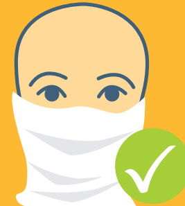
Schal oder Schlauchtuch